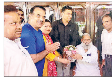
अंबाला। विज का आभार जताते महेशनगर के लोग।