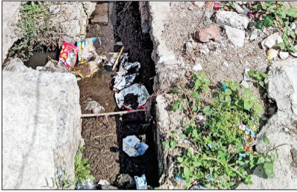
छिंबी मोहल्ला में सफाई न होने पर गंदगी से भरी नाली।

कस्बा के छिंबी मोहल्ला, नदी के पास स्थित नाला व नालियां गंदे पानी से अटी होने के कारण गंदगी से लबालब हो गए हैं। जिससे हर समय बदबू आने से स्थानीय लोग बेहद परेशान हैं। वहीं मोहल्ला निवासियों को बरसात होने पर नालियों का गंदा पानी घरों में घुसने का डर सताने लगता है। स्थानीय लोगों ने कई बार नपा सफाई कर्मचारियों को मामले की जानकारी दी। लेकिन नपा सफाई