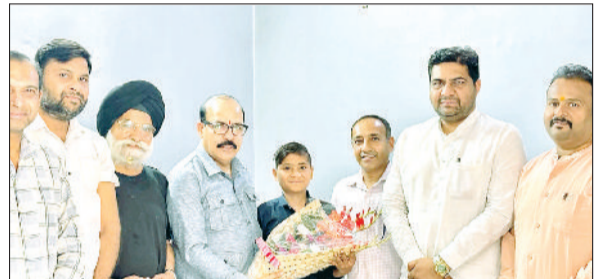
यमुनानगर। प्रथम बराड़ को सम्मानित करते जिला अध्यक्ष व अन्य।