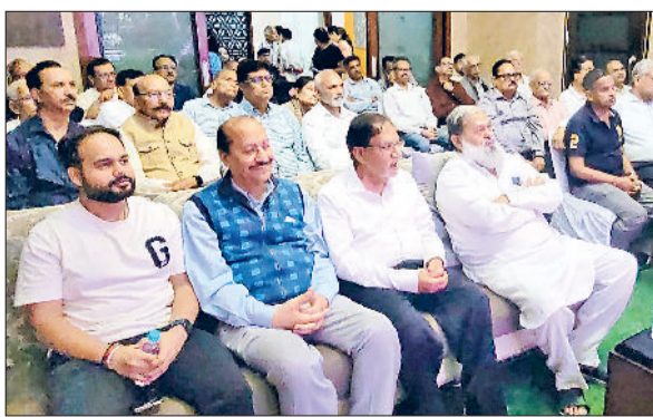
अंबाला। मन की बात कार्यक्रम देखते मंत्री अनिल विज।

उन्होंने कहा कि प्रधानमंत्री नरेंद्र मोदी हमारे प्रिय मित्र, फिलोस्फर व गाइड हैं। मन की बात कार्यक्रम के