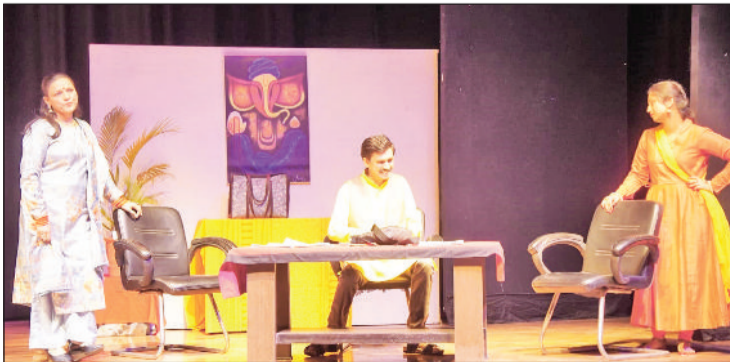
कुरुक्षेत्र। नाटक में प्रस्तुति देते कलाकार।

कभी-कभी व्यक्ति इच्छाओं और महत्वाकांक्षाओं के वशीभूत होकर अनाप-शानाप निर्णय ले लेता है। ऐसे निर्णयों में वंशबल बढ़ाने का निर्णय भी एक खास जगह रखता है। अक्सर लोग वंश बढ़ाने के चक्कर तथा बेटे की लालसा में बच्चे पैदा करते रहते हैं। या जिनके बेटा नहीं होता तो दूसरी शादी करने का मन बना लेते हैं। ऐसी परिस्थिति बनने पर पति हास्यपूर्ण स्थिति में फंस जाता है और न घर का रहता है ना घाट का। इसी परिस्थिति को सार्थक करता नजर आया नाटक घर का न घाट का। विश्व रंगमंच दिवस के अवसर पर हरियाणा कला परिषद द्वारा कला कीर्ति भवन में आयोजित तीन दिवसीय रंगरथ नाट्य महोत्सव की दूसरी शाम में रंग मंडप दिल्ली के कलाकारों द्वारा