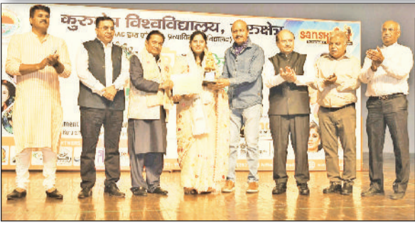
कुरुक्षेत्र। कलाकार को सम्मानित करते आयोजक।