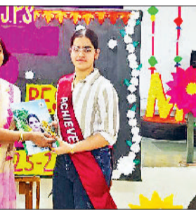
बराड़ा। बच्चे को सम्मानित करती प्रिंसिपल।