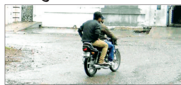
यमुनानगर। बारिश में भीगते हुए अपने गंतव्य पर जाते हुए राहगीर।

जिले में पिछले एक पखवाड़े में रविवार को तीसरी बार हल्की बारिश व बूंद बांदी होने से किसान खेतों में पहले से बिछी पड़ी गेहूं की फसल को लेकर चिंतित हो उठे। किसानों की मानें तो यदि अगले एक दो दिन इसी तरह हल्की बारिश व बूंदबांदी हुई तो उनके खेतों में पहले से बिछी पड़ी गेहूं में नुकसान होने की आशंका है। रविवार सुबह नौ बजे तक मौसम साफ था और आसमान में कहीं कहीं बादल छाए हुए थे। मगर सुबह दस बजे के करीब अचानक आसमान में घने बादल छा गए और हल्की बारिश शुरू हो गई और मौसम में ठंडक बढ़ गई। जिले में दिन भर रुक रुक कर कहीं हल्की बारिश हुई तो कई स्थानों पर बूंद बांदी हुई। आलम