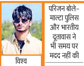
परिजन बोले- माल्टा पुलिस और भारतीय दूतावास ने भी समय पर मदद नहीं की