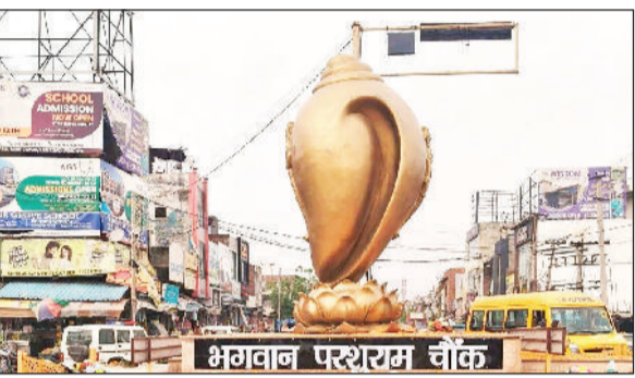
पिहोवा। परशुराम चौक पर बन्द पड़ी लाल बत्ती।